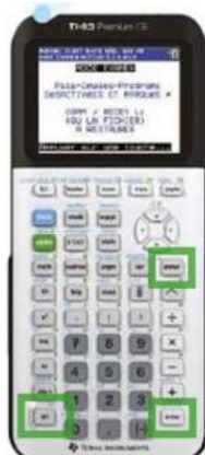
TI 83 CE